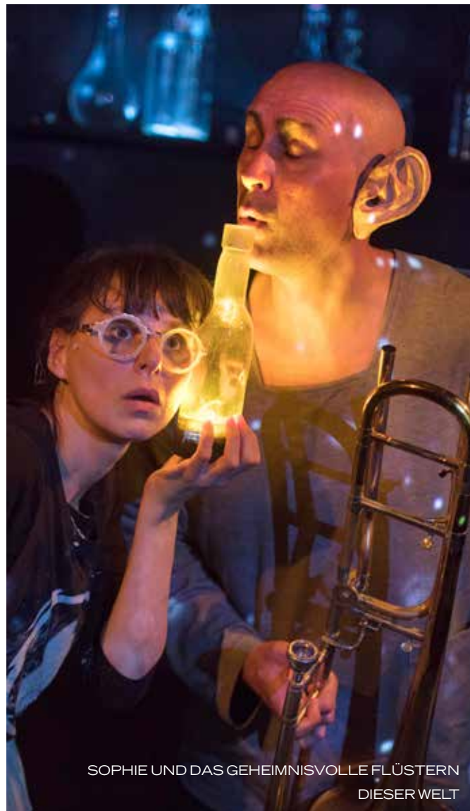
SOPHIE UND DAS GEHEIMNISVOLLE FLÜSTERN DIESER WELT